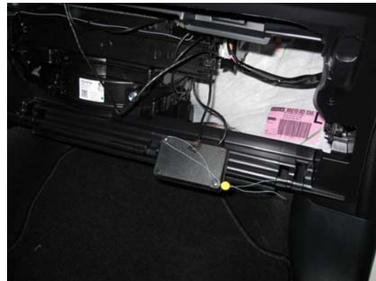
Montaje tras guantera