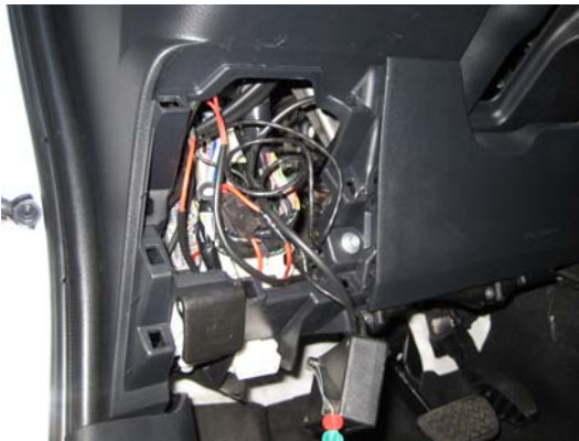
Montaje en tapa bajo salpicadero

Si se necesita una caja de conexiones, se puede montar bajo el salpicadero, tras una tapa de fácil retirada. La caja irá precintada y el cable de señal será continuo desde la toma. También se puede montar detrás de la guantera, que es fácilmente desmontable: