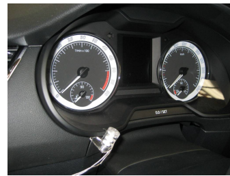
Precintado cuadro de instrumentos

La salida de señal taquimétrica será llevada al taxímetro por un cable continuo sin empalmes en su recorrido, si se necesita una caja de conexiones ésta será precintable y se puede colocar tras una pequeña tapa desmontable en el lado izquierdo del salpicadero: